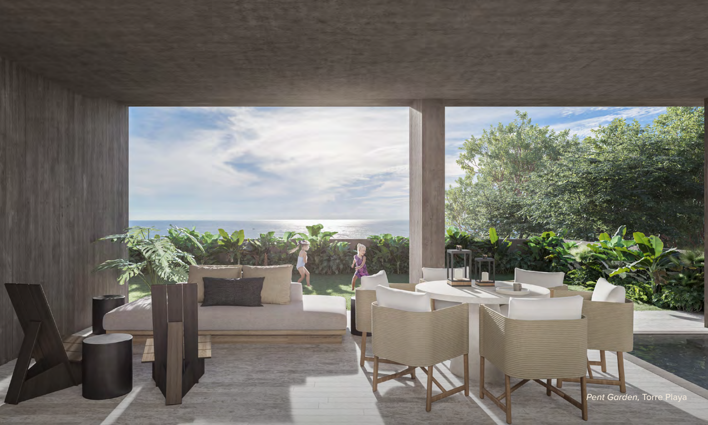
Pent Garden, Torre Playa