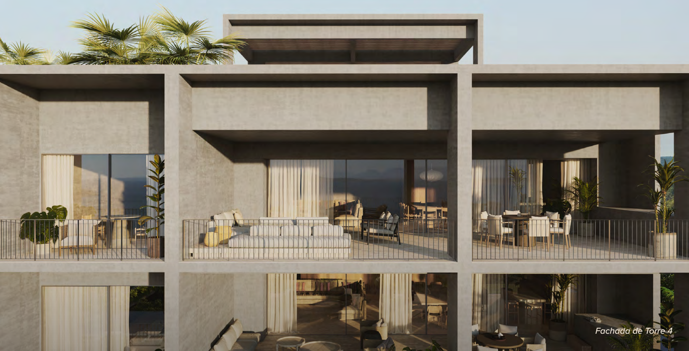
Fachada de Torre 4